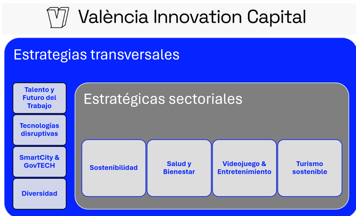
Figura 3: Ejes estratégicos de los premios València Innovation Capital.